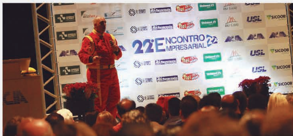
Narrativa dinâmica envolveu o público durante palestra

Para este evento, a ACIA contou com o patrocínio de importantes parceiros como Animal Planet, Guia Internet Araras, NF Service, Posto Ecoflex, Rei dos Móveis, Reverauto, Sicoob Uni Mais, Unimed, Usina Santa Lúcia e Usina São João.